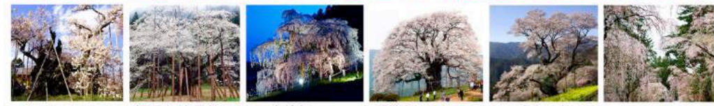
山高神代桜 山梨県北杜市 推定樹齢2000年 御手植・日本武尊 根尾谷淡墨桜 岐阜県本巣市 推定樹齢1500年 御手植・椎体天皇 三春滝桜 福島県三春町 推定樹齢1000年 醍醐桜 岡山県真庭市 推定樹齢1000年 伝・後醍醐天皇御遷賞 ひょうたん桜 高知県仁淀川町 推定樹齢500年 一説・武田勝頼植 角館武家屋敷桜 秋田県仙北市 推定樹齢300年超

宇宙桜とは、若田光一宇宙飛行士とともに、宇宙を旅し、地球を4100周した名桜(日本三大桜倉)の種から育てられた巨桜の直系子孫。数千年生き、公園の桜の数倍巨大化する、稀少な品種です。